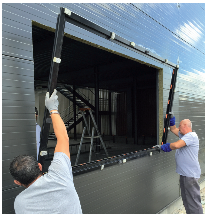
Le précadre acier conçu en co-développement entre le Groupe DEYA et Arval by ArcelorMittal Construction facilite la pose d'une fenêtre et assure une parfaite étanchéité à l'eau et à l'air ainsi qu'une isolation thermique.

ArcelorMittal Construction a annoncé courant septembre sa volonté de renforcer sa production de panneaux sandwich en France. Les investissements réalisés sur les lignes de production pour permettre la fabrication des panneaux sandwich Promisol®